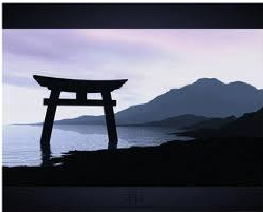
zensymbool voor de poortloze

De eerste Poortwachter die we al een beetje hebben leren kennen is de innerlijke Criticus. De Criticus is een voorhoede Poortwachter (in tegenstelling tot de massieve 'waakhonden' die we later tegen zullen komen); hij is diegene die ons lang voordat er ook maar een drempel in zicht komt, angst aanjaagt en weghoudt. De Criticus is een mobiele Poortwachter, een soort verkenner. Die zorgt ervoor dat je je aan de regels houdt, en om dat goed te kunnen doen, bespeelt hij je met de negatieve overtuigingen die je over jezelf hebt. De Criticus zorgt ervoor dat je veilig bent en blijft in je huidige leventje, en dat je niet te veel je nek uitsteekt, dat je binnen de comfortzone blijft. Op mentaal niveau kun je het NOOIT winnen van de Criticus! Ga maar na: als je van je Criticus harder moet worden en dat uiteindelijk doet, pakt hij je erop dat je zo ongevoelig bent. Als hij vindt dat je je uiterlijk verwaarloost en oerlelijk bent en je luistert ernaar door naar de kapper te gaan en nieuwe kleren te kopen, dan vindt hij je een ijdeltuit, waar mensen zó doorheen prikken. Om de Criticus uit zijn functie te ontheffen moeten we niet naar hem luisteren, omdat zijn taal niet de onze is, maar aangeleerde taal van anderen, zoals we zagen. Maar we moeten hem wel hōren. Horen met het hart, horen dat hij in wezen doodsbang is dat jij weer gekwetst wordt.